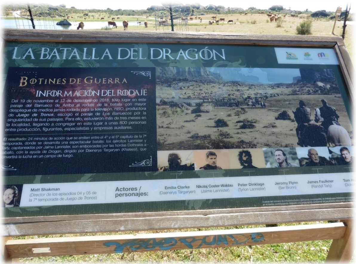
De Amerikaanse televisiezender en -producent HBO koos het prachtige Extremadura als decor voor scènes uit het zevende seizoen van Game of Thrones. Onder andere in Los