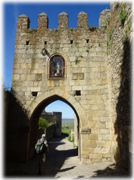
We wandelen rond het kasteel door velden met koolzaad, sleutelbloemen, klaprozen en vele andere voorjaarsbloemen.