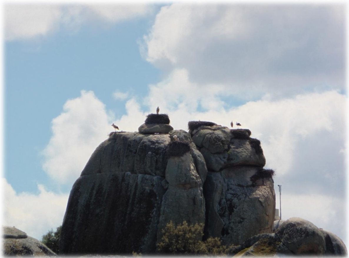
Het meest in het oog springend zijn de enorme rotsen waarop in het voorjaar ooievaars broeden. De wandeling is gesitueerd rond deze rotsen en een drietal stuwmeertjes in het park.