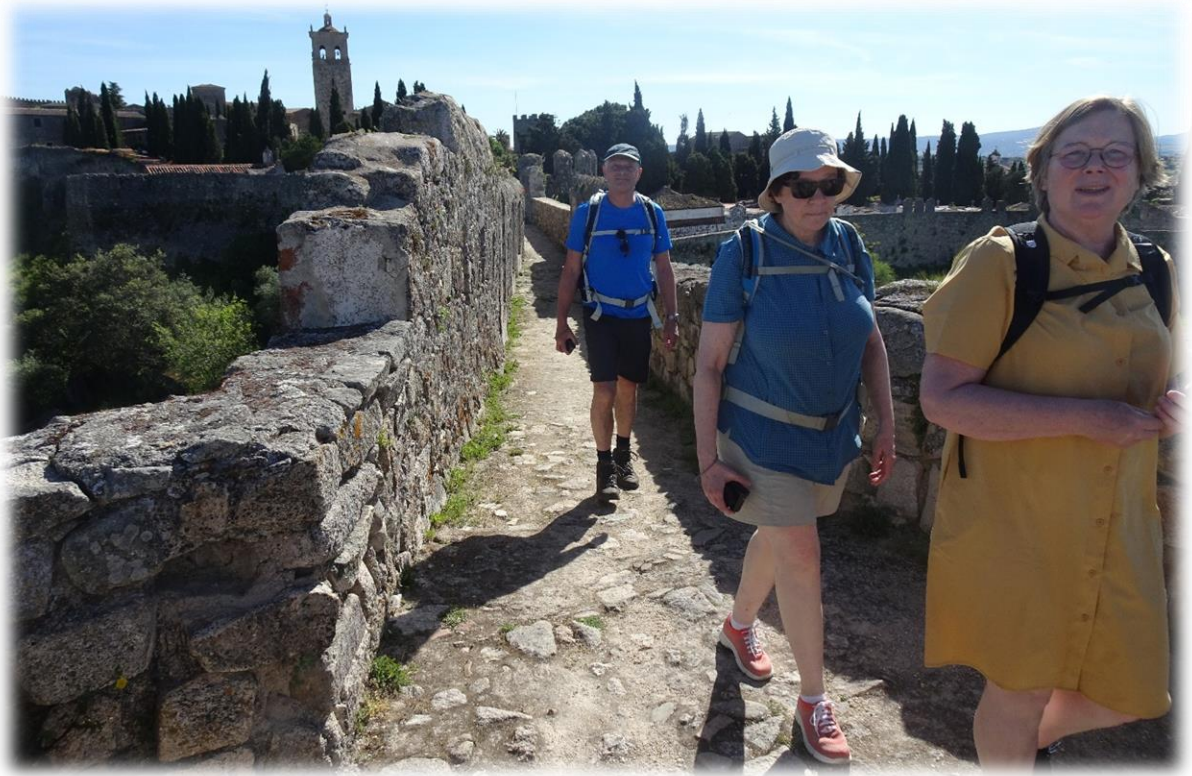
Alles in Trujillo ruikt naar de middeleeuwen, met als hoogtepunt het imposante Castillo de Trujillo. Het kasteel werd in de twaalfde eeuw gebouwd op de resten van een vroeger