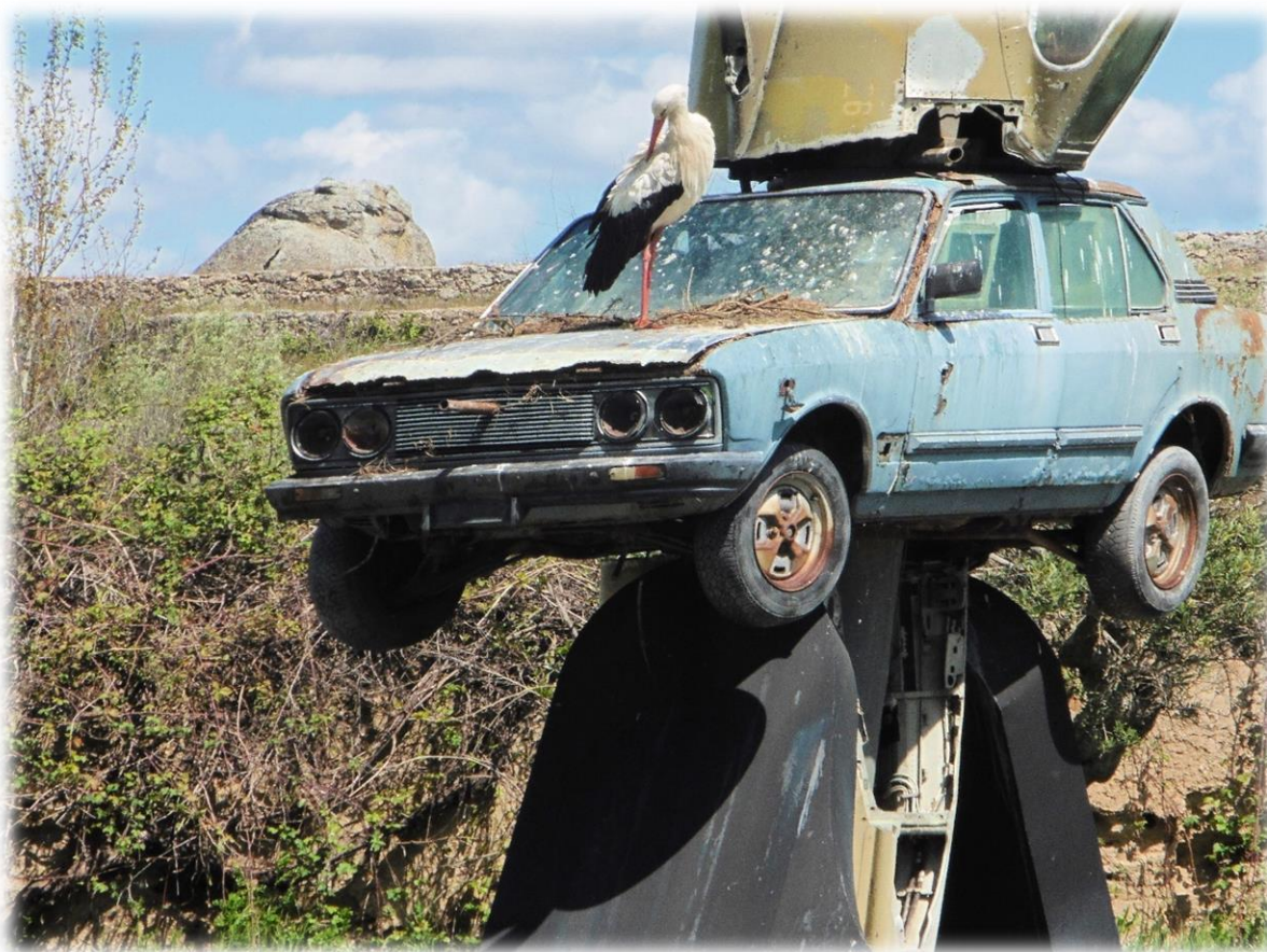
Het surrealistische landschap wordt gecompliceerd door de tientallen ooievaars die nestelen