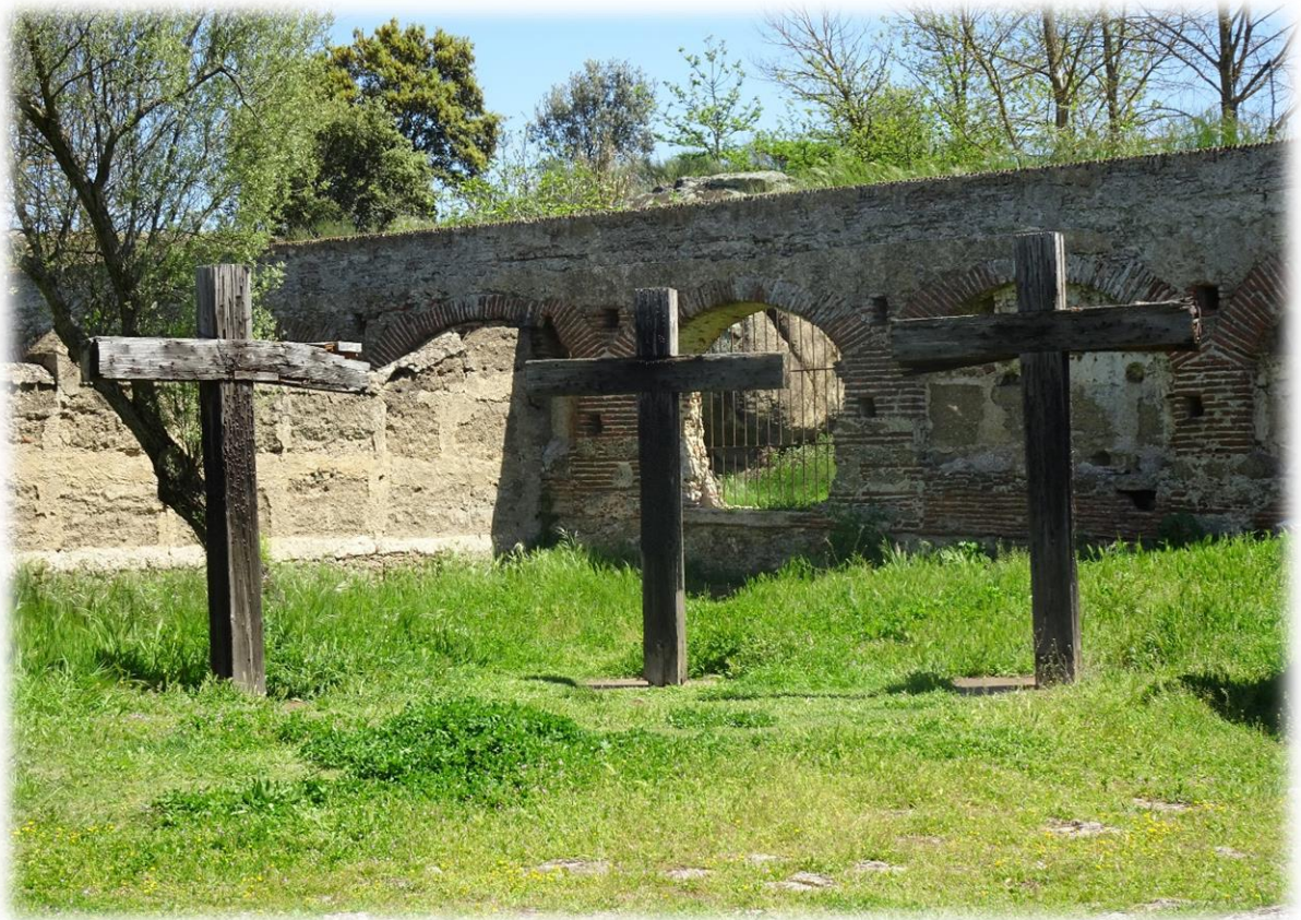
Dit zou een kunstwerk van Yoko Ono zijn. Gewoon drie houten kruisen.